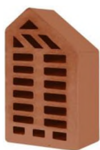
Цвет: Корица Рельеф: Гладкий