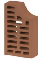
Цвет: Терракотовый Рельеф: Гладкий