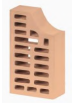
Цвет: Соломенный Рельеф: Гладкий