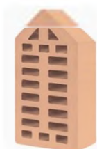
Цвет: Соломенный Рельеф: Гладкий