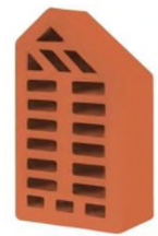
Цвет: Красный Рельеф: Гладкий