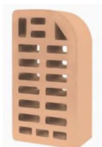
Цвет: Соломенный Рельеф: Гладкий