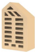
Цвет: Слоновая кость Рельеф: Гладкий