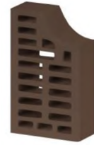
Цвет: Коричневый Рельеф: Гладкий