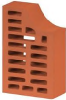
Цвет: Красный Рельеф: Гладкий